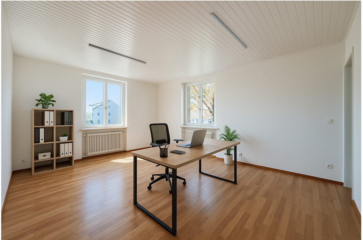
Büro / Warteraum