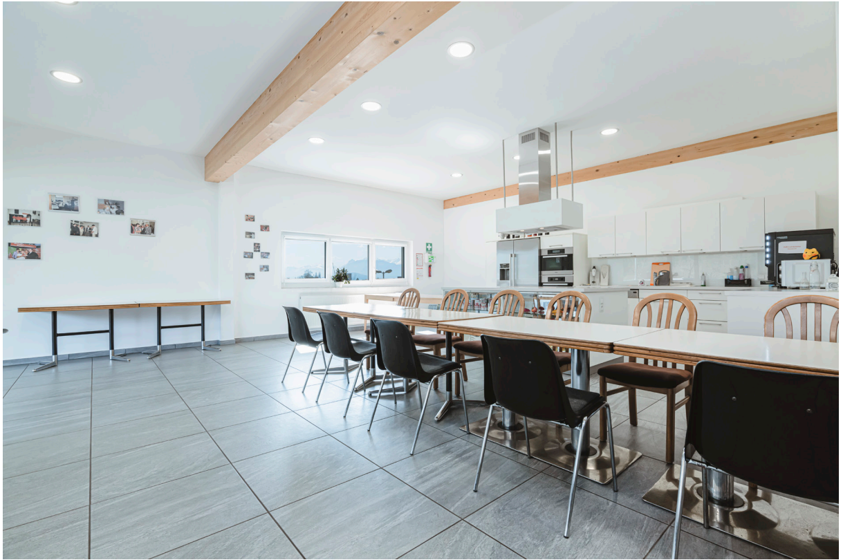
Küche / Aufenthaltsraum 2.OG