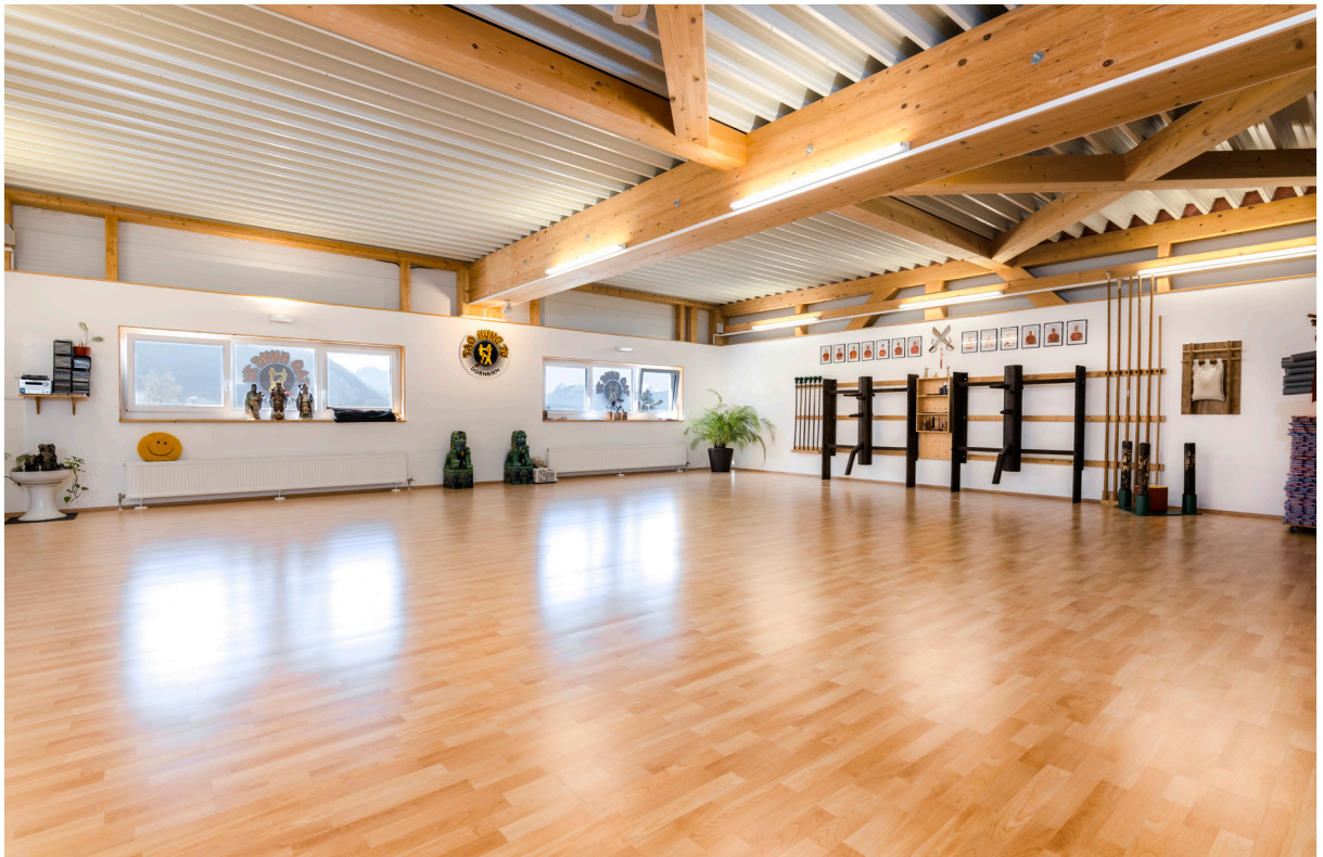
Vermietete Fläche 2.OG