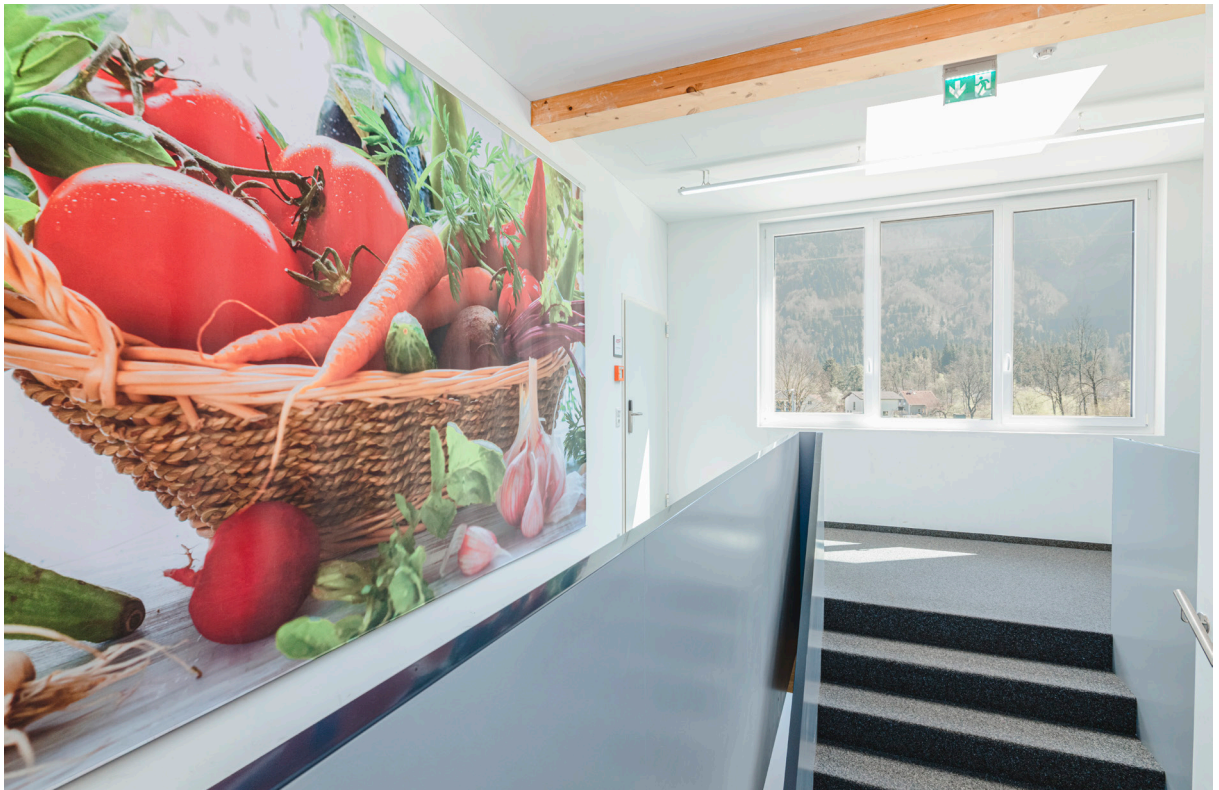
Diele / Stiegenaufgang