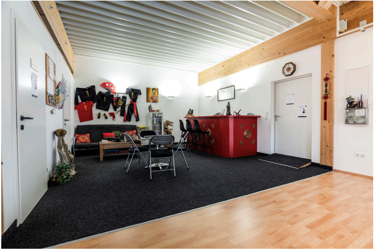
Vermietete Fläche 2.OG