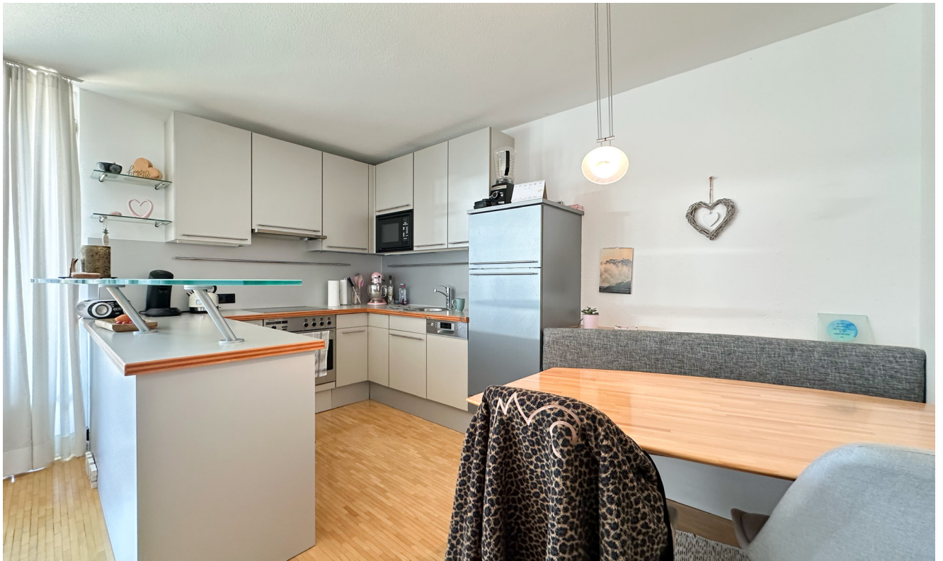
Kochen / Essen