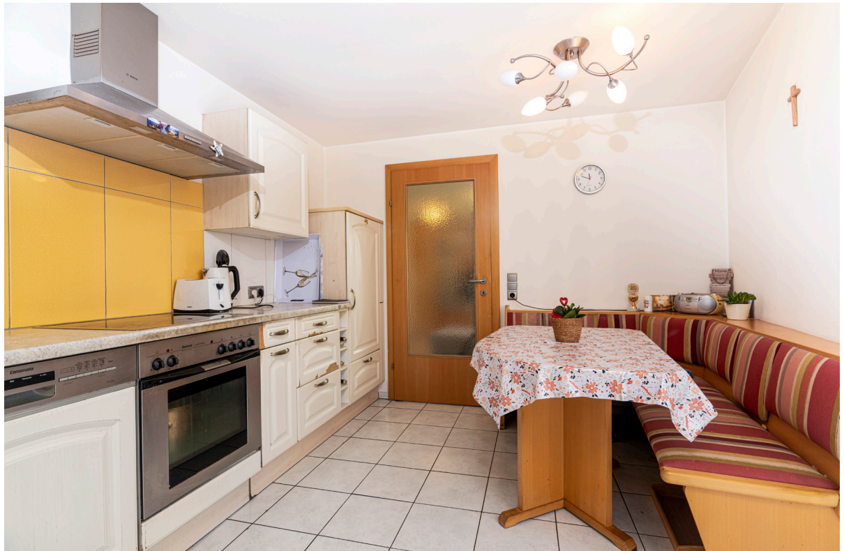
Kochen / Essen