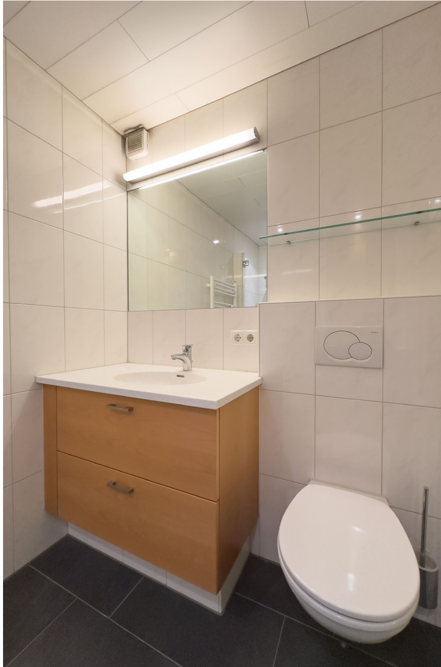
Bad / WC