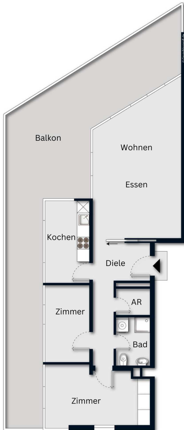
Grundriss ohne Maßstab