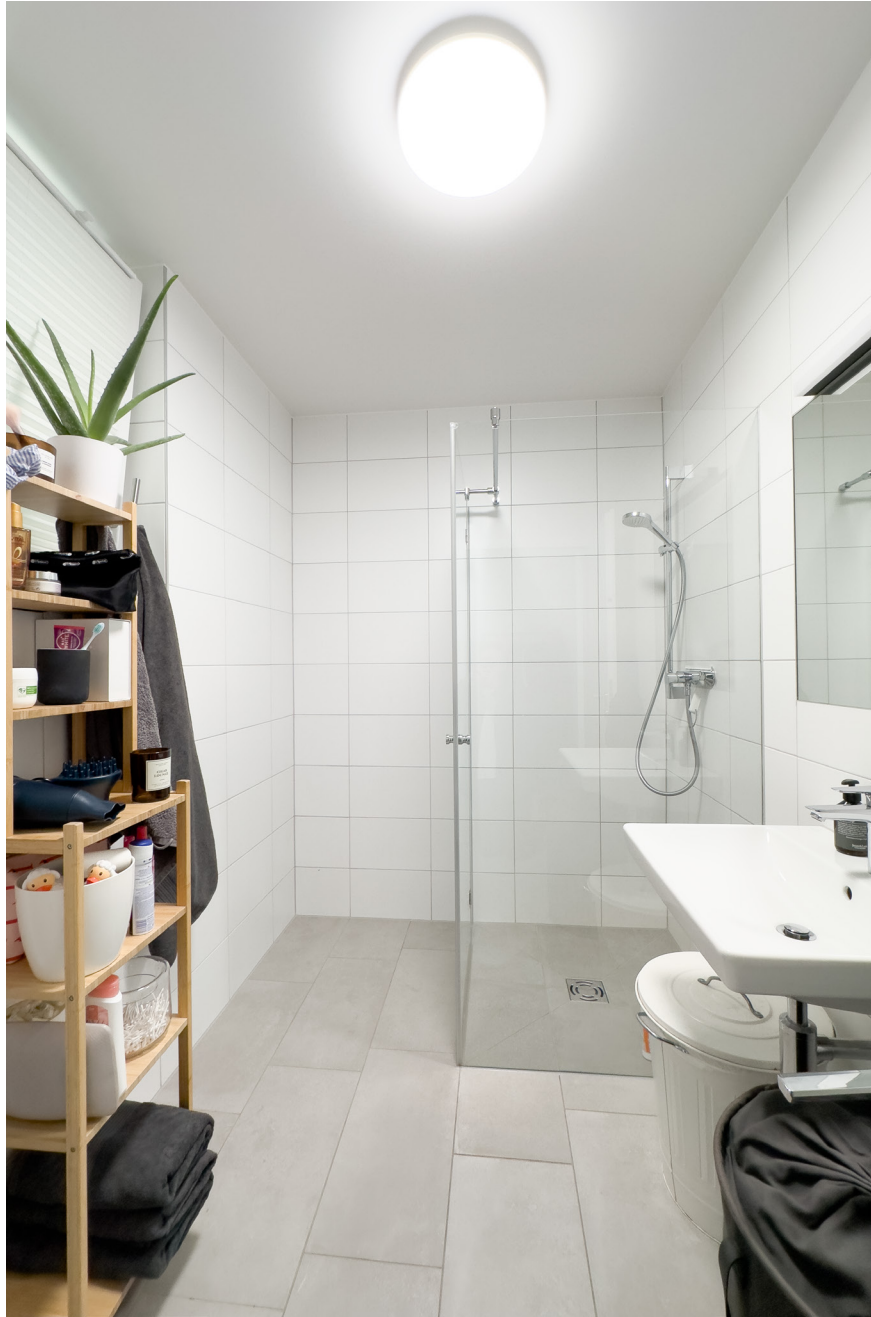
Bad / WC