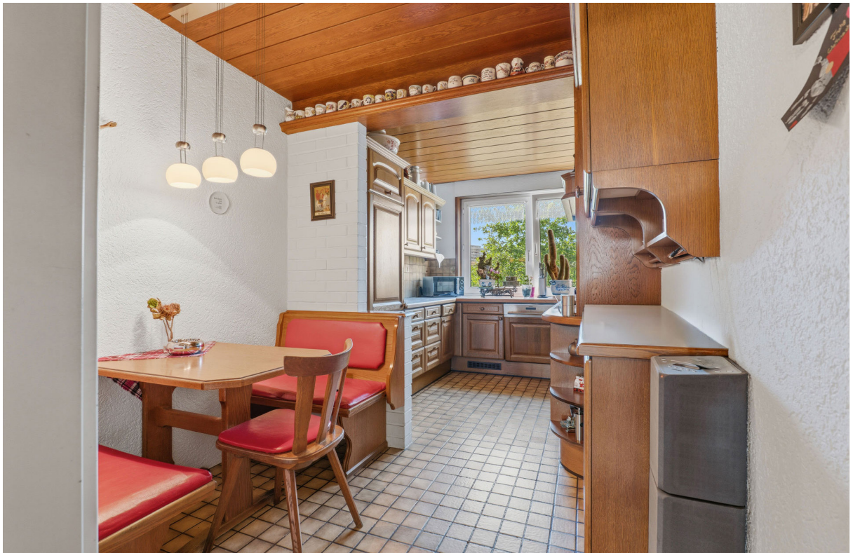
Kochen / Essen