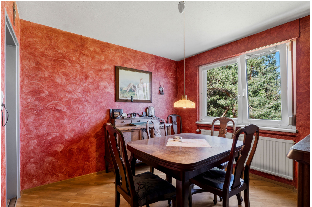
Essen / Zimmer