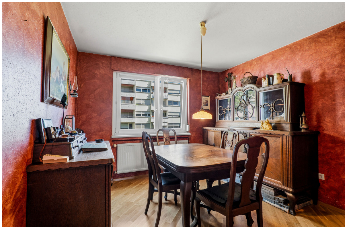
Essen / Zimmer