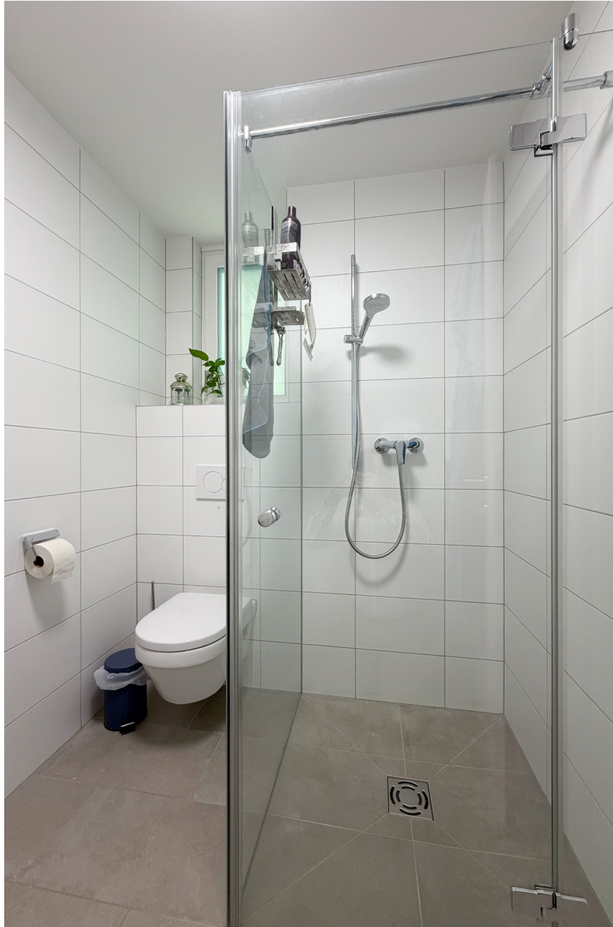
Bad / WC