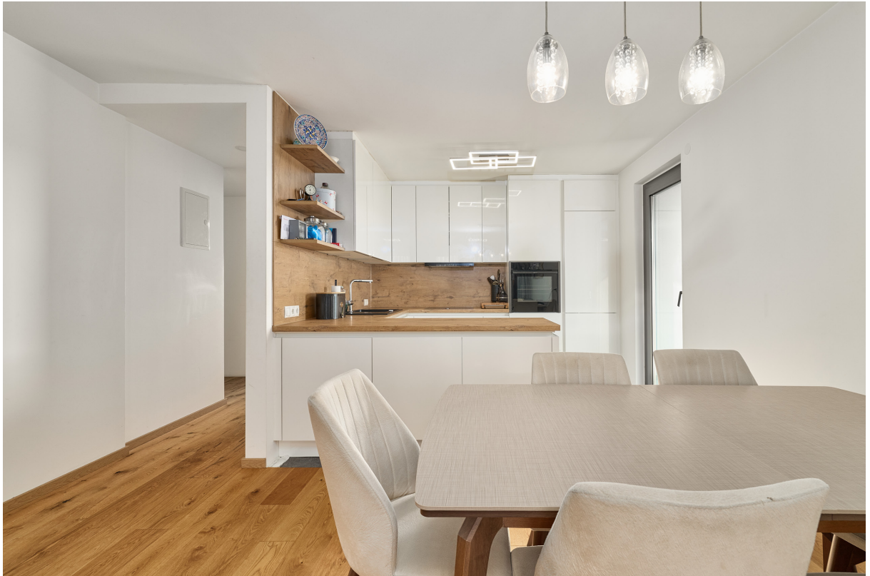
Kochen / Essen