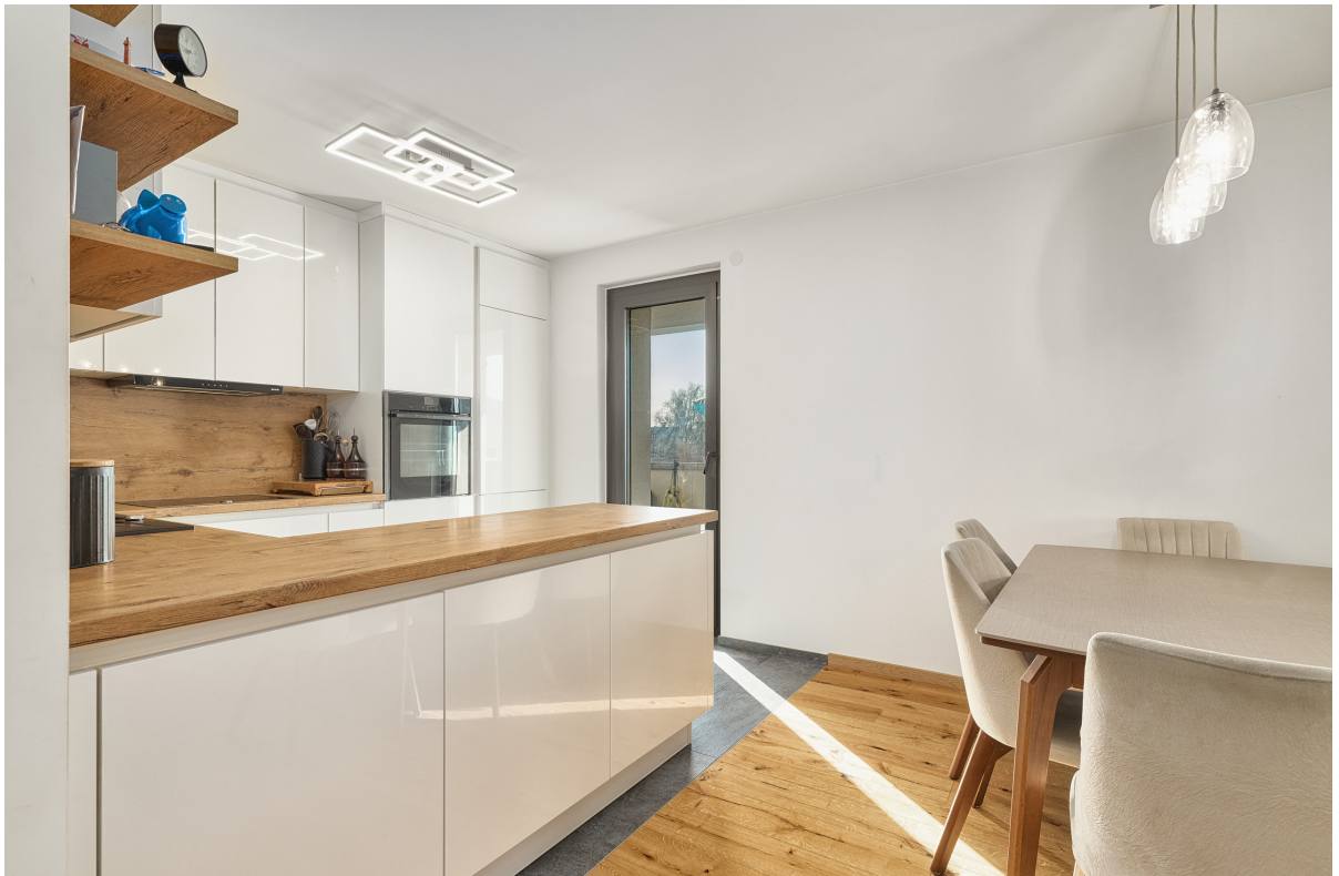
Kochen / Essen