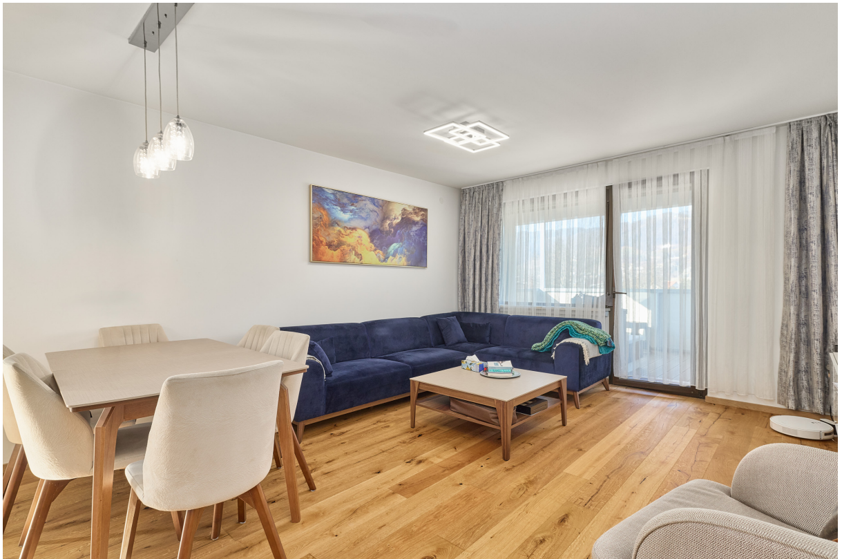
Essen / Wohnen