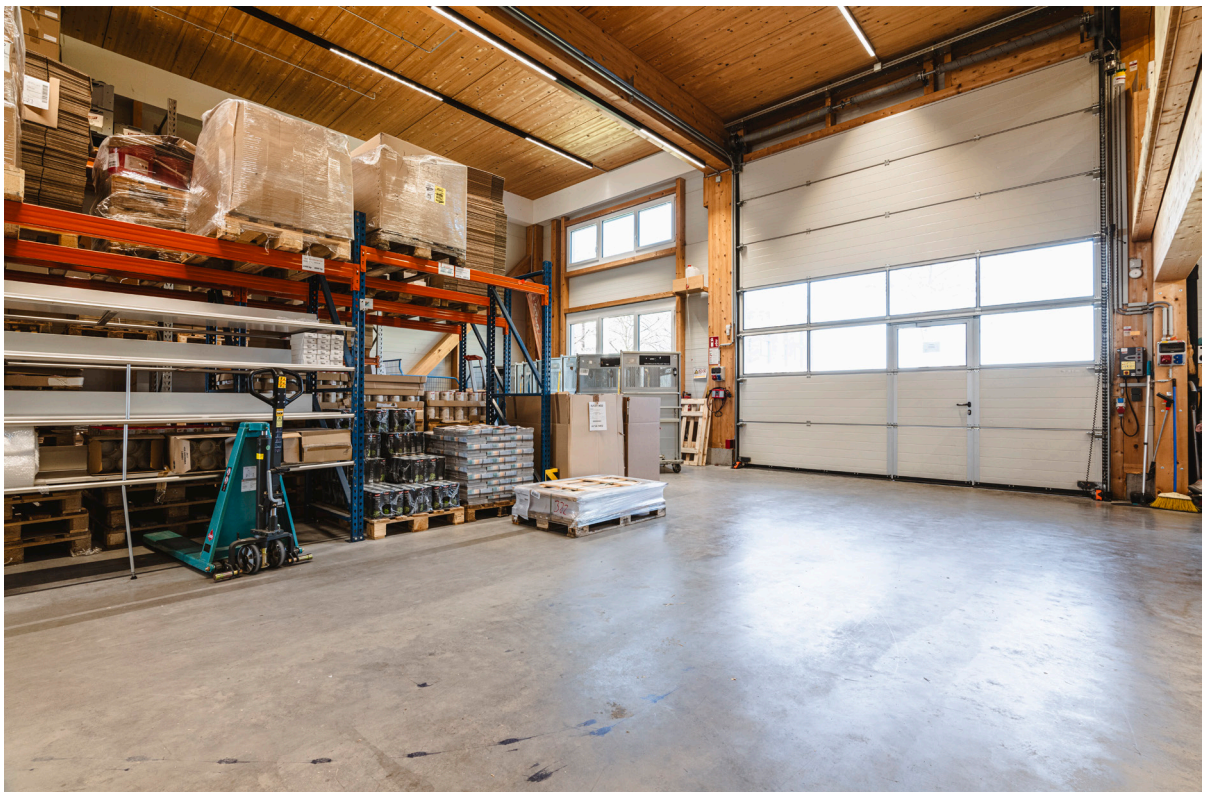
Lager / Anlieferung EG