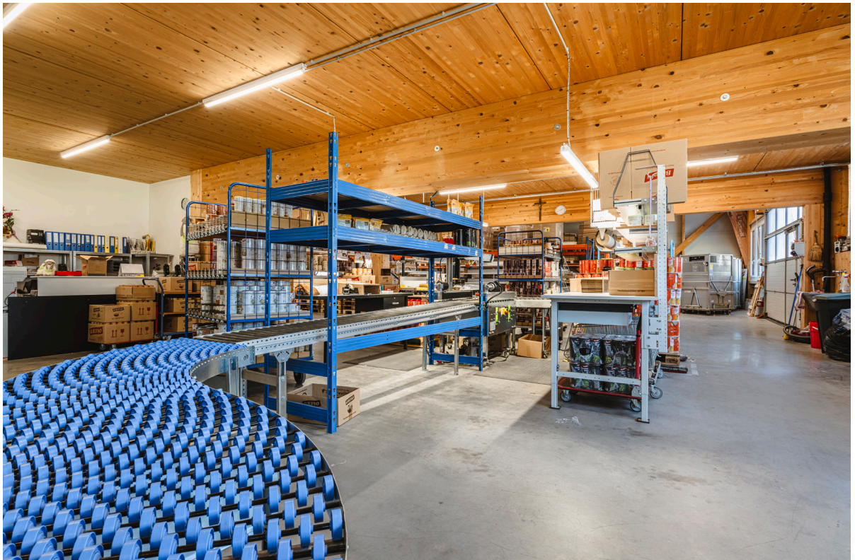
Lager / Verpackung EG