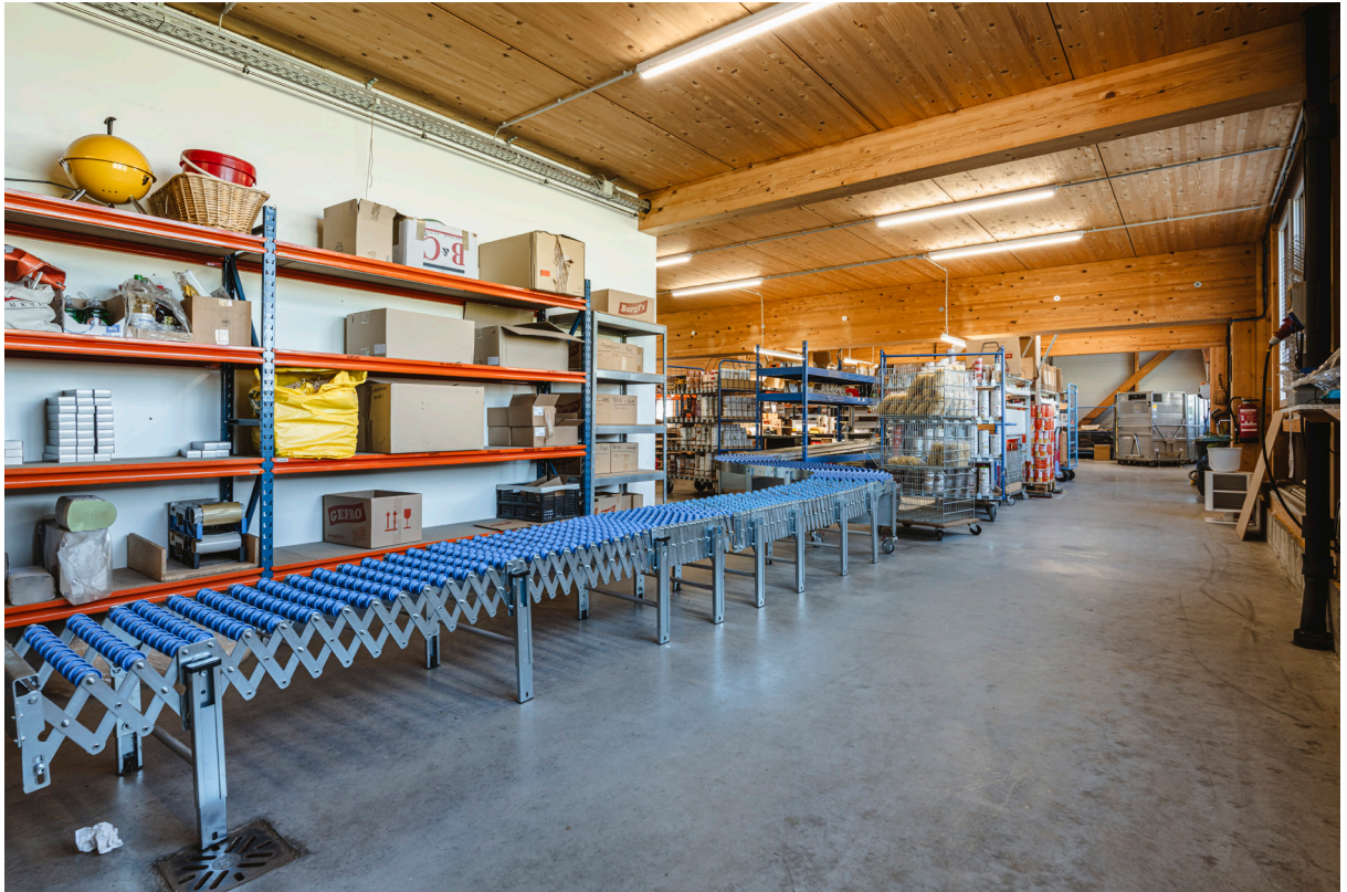
Lager / Verpackung EG