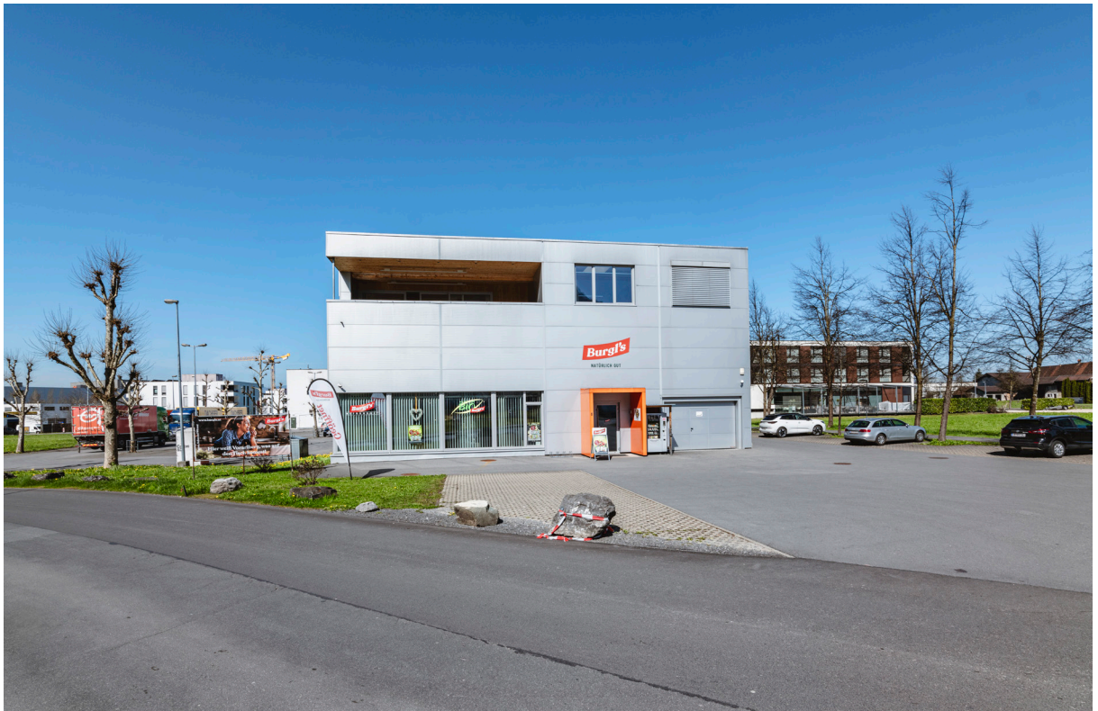
Gebäudeansicht / Zufahrt