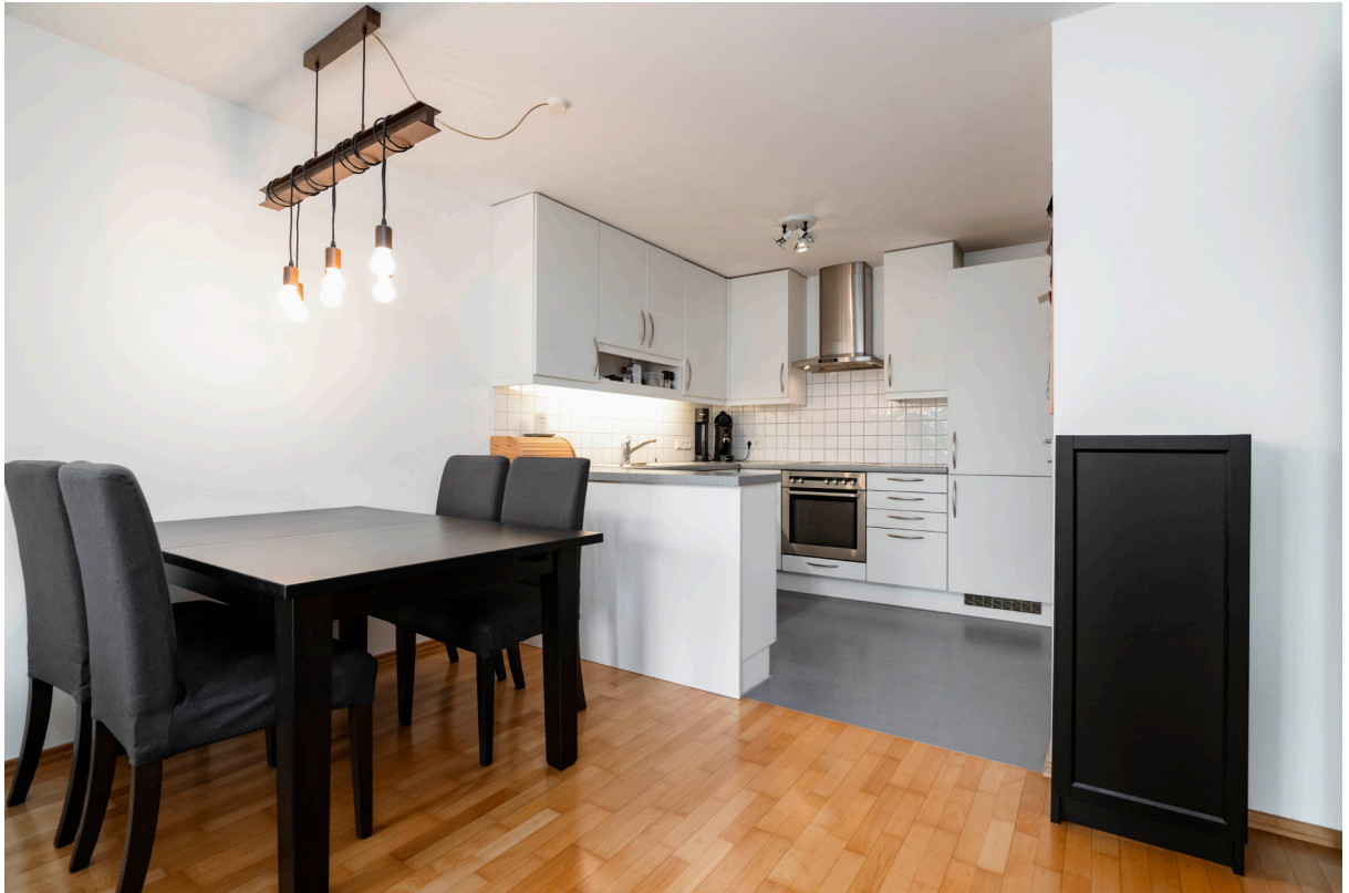
Kochen / Essen